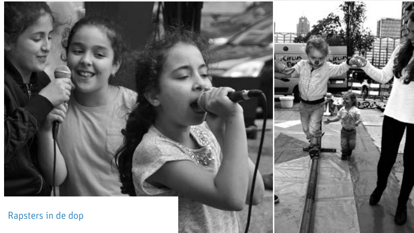
Rapsters in de dop